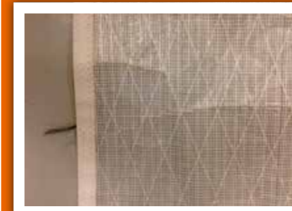
Cruisinglaminat i radiell skärning. Drygt tio år gammalt. Formen har blivit sämre och det har blivit veck på duken.