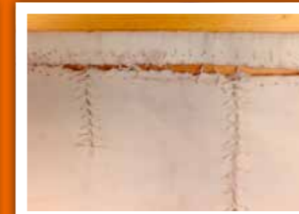
Dacron med crosscut. Uppskattningsvis tillverkad för 15 år sedan. Vid akterliket finns en rejäl reva som ska repareras med nya mindre paneler.