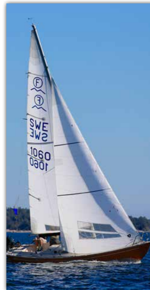
IF med crosscut skurna segel av vävd dacron.