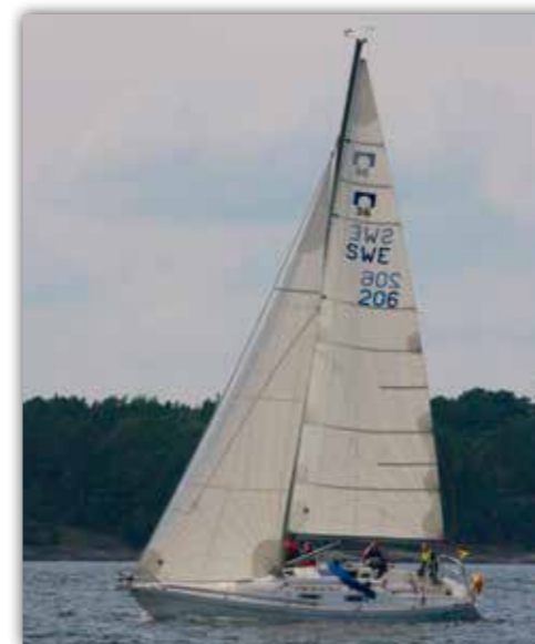
Omega 36 med storsegel och genua i radialskurna cruisinglaminat av polyester.