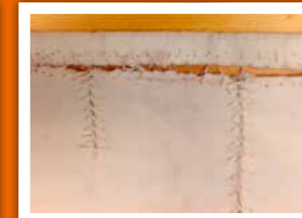
Dacron med crosscut. Uppskattningsvis tillverkad för 15 år sedan. Vid akterliket finns en rejäl reva som ska repareras med nya mindre paneler.