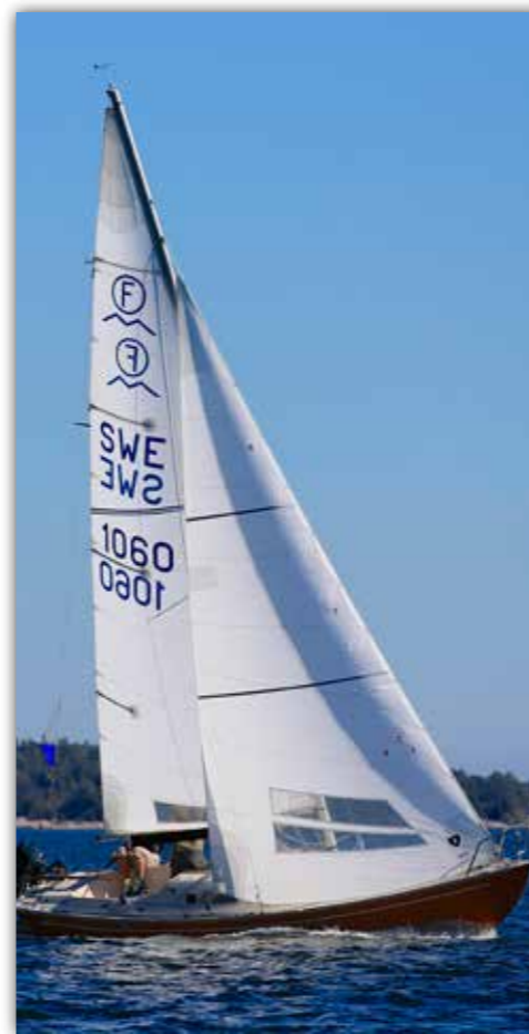
IF med crosscut skurna segel av vävd dacron.