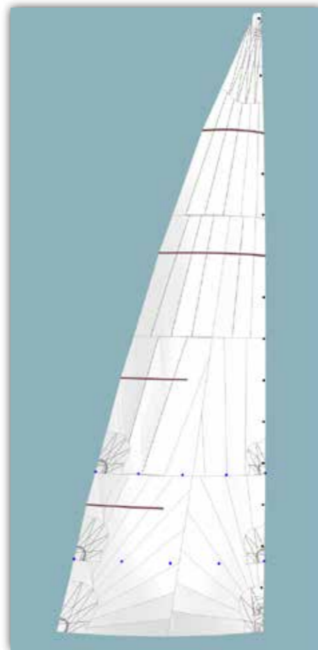
Radiella skärningar. Det innebär att fiberriktningarna strålar ut från seglets horn.